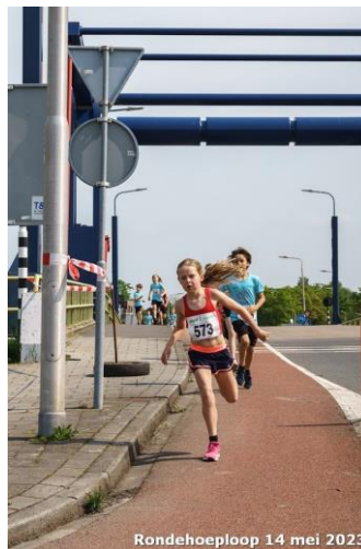
Rondehoeploop 14 mei 2023