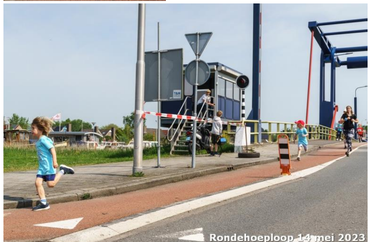
Rondehoeploop 14 mei 2023